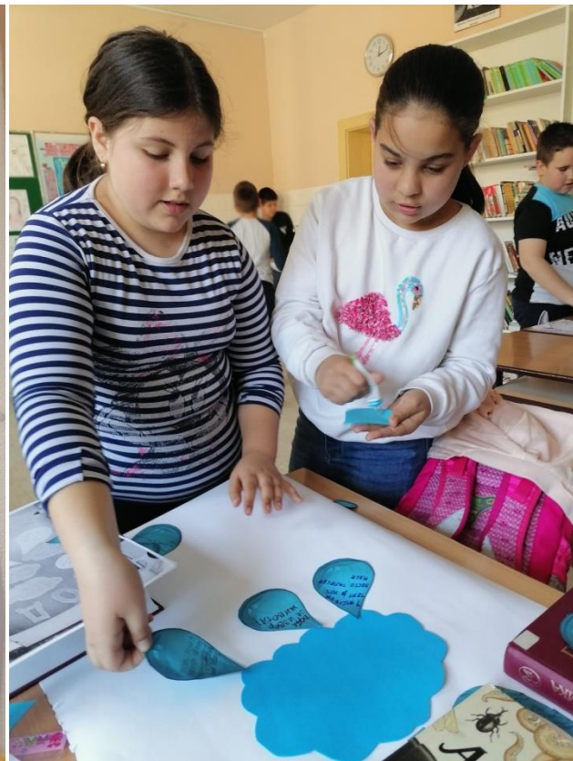
Извештај саставила: Милена Миладинов, водитељ модула активности-Екологија.